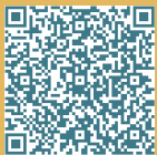
QR-Code zur Anmeldung

Bei Fragen zur Anmeldung wenden Sie sich gerne an die aufgeführten Kontaktpersonen.